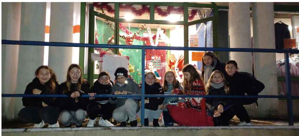
Tous les jouets donnés lors de cette collecte ont été exposés